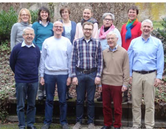
Vorstände & Mitarbeiterinnen beim Start des Entwicklungsprozesses im Februar

Titel: Der Oikocredit Partner Guardian hat in Keeranur/Indien einen Wasseranschluss eingerichtet.